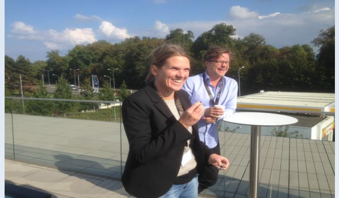
Kafferast för SBBFs personal på FIBA House i Genève..

Fokus i projektet och ute i Basketdistriktförbunden ligger på föreningsstöd. Det handlar om att identifiera vad föreningar vill ha & framförallt vad de behöver för att sedan prioritera insatser. Ett område som diskuteras på flera håll är breddbasket för äldre ungdomar, såväl nybörjare som erfarna. Flera goda initiativ har satts och dessa piloter ger oss en idé om vad som funkar och hur vi kan satsa nationellt på detta. Er input är naturligtvis välkommen här. För en tid sedan efterlyste Alvik Basket besked om hur föreningar kan jobba strategiskt mot målet ihop med projektet. Vi gläds åt att Alvik räcker ut en hand på detta vis och naturligtvis vill vi diskutera detta vidare. Alla föreningar som är intresserade av att delta i detta jobb är varmt välkomna att höra av sig.