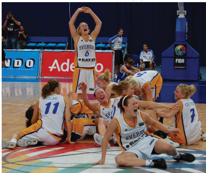
Efter slutsignalen i semifinalen mot Serbien.

- Många av oss har spelat med varandra i flera år. På somrarna har vi varit på läger och turneringar. Där har vi både spelat och umgåtts tätt in på varandra. Vi har gått igenom både med- och motgångar och knutit starka band