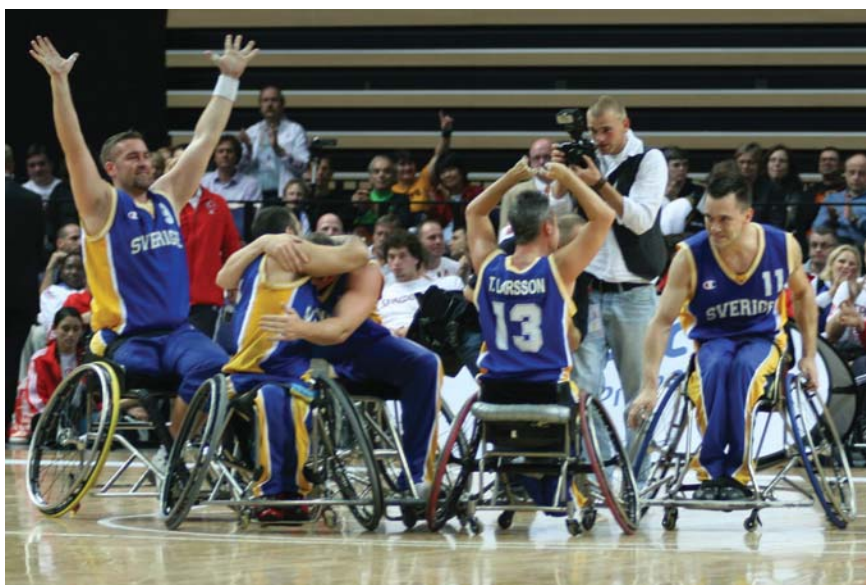
Glädjeyra efter EM-guldet!

- För oss har det varit det. Vi låter spelarna sätta upp målsättningarna själva. De är själva delaktiga i målsättningarna. Jag tror man måste sätta upp höga mål och våga vinna. Sätter man höga mål när man långt.